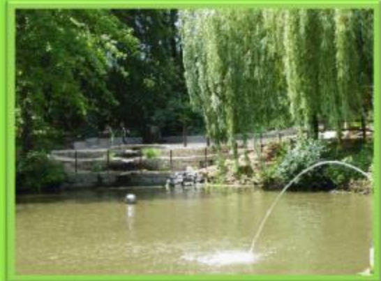
Element "Schwester Wasser"