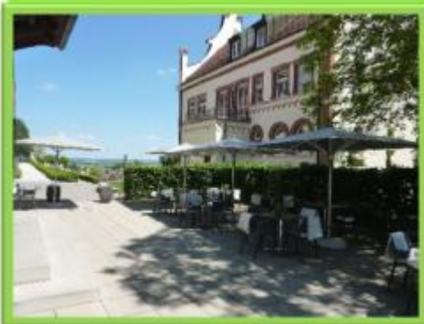
Klostercafé - Außenbereich