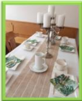
Haus Tabor (klein)