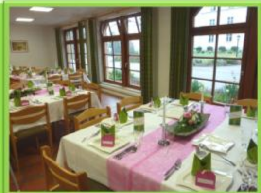
Haus Tabor (groß)