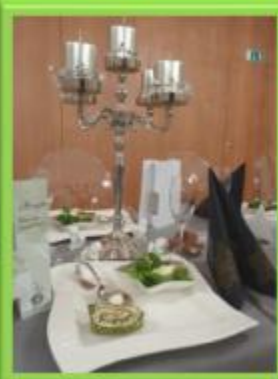
Haus Faustin Mennel - Festsaal