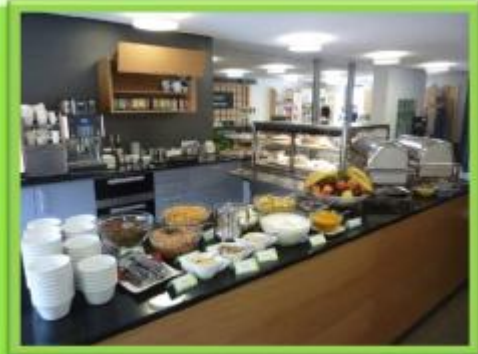
Foyer - Empfang - Klostercafé