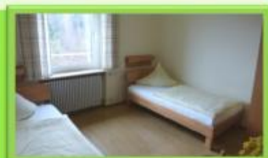
Haus Faustin Mennel