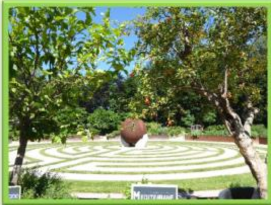
Element "Mutter Erde"