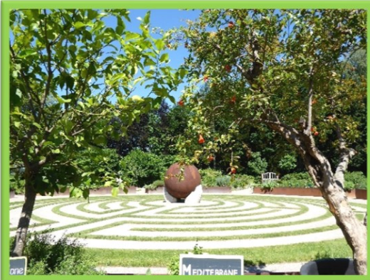
Station "Mutter Erde"

Am Kloster führt der Oberschwäbische Pilgerweg vorbei sowie der Martinusweg zwischen den zwei Martinuskirchen Tannheim und Erolzheim.