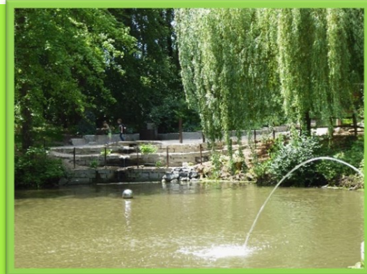
Station "Schwester Wasser"